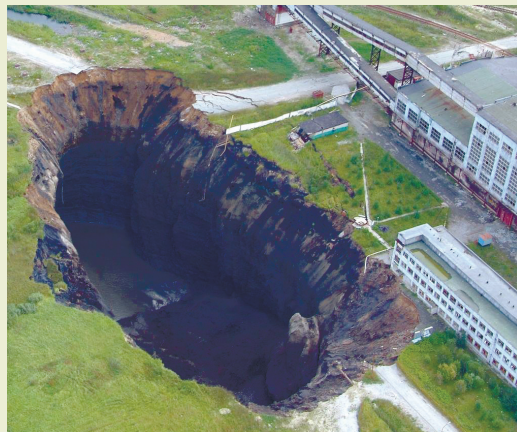
Провалы в городе Березники.

Но из-за резкого падения объемов продаж в кризис компания обеще-